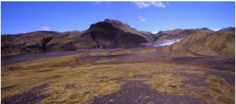
Samanburður á Sólheimajökli árin 2000 og 2006