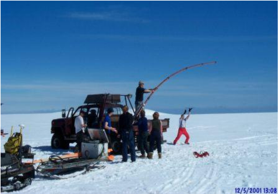
Afkomumælingar með tilþrifum – Mýrdalsjökull í maí 2001.