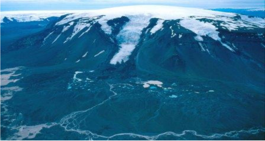
Eiríksjökull úr norðri.