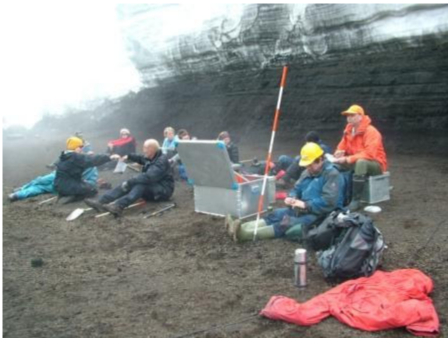
Matartími niðri í Grímsvatnagíg.

Fimmtugasta og fjórða vorferð JÖRFÍ lagði upp frá Reykjavík föstudagskvöldið 2. júní og gekk ferðin í Jökulheima án tíðinda. Á laugardeginum var heiður himinn og gæfan brosti við hópnum. Svítu Landsvirkjunar var komið í jökulrönd þar sem snjóbíll HSSR beið átaka dagsins. Kerrur voru hlaðnar eldsneyti og öðrum flutningi og nálægt hádegi héldu vélsleðar til mælinga, að Pálsfjalli og Hamrinum. Lest snjóbíls og jeppa hélt af stað um sama leyti og náði á Grímsfjall undir kvöld. Eftir óvenju kaldan maí-mánuð var vetrarlegt um að litast í Grímsvötnum miðað við undanfarin ár. Sólbráð kringum öskubingi var sáralítill og mikill snjór var ennþá kringum skálana á Eystri Svíahnjúk.