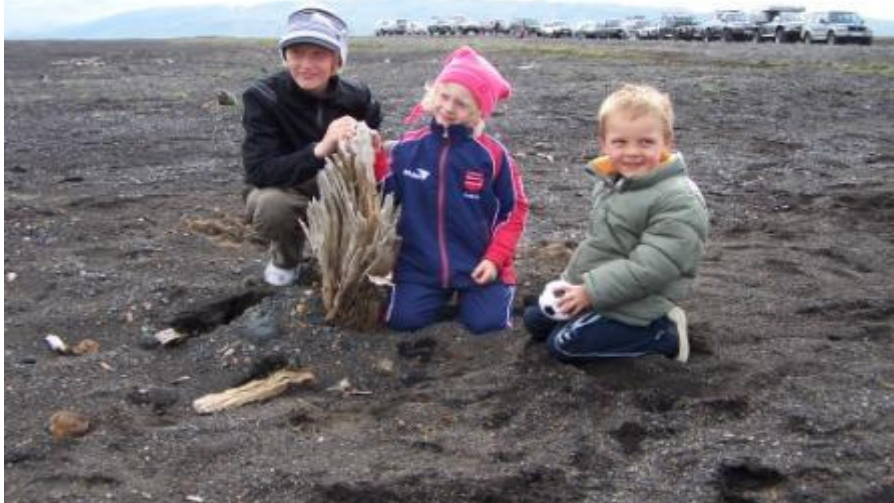
Ungir JÖRFÍ félagar skoða leifar af skóginum í Drumbabót.