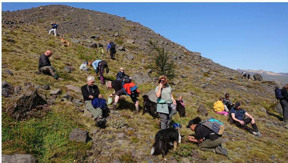
Sumarferðin í berjamó í mynni Steinholtaldals.

Sumarferð JÖRFÍ var farin helgina 9. – 11. ágúst. Að þessu sinni var farið í Bása í Þórsmörk þar sem flestir tjölduðu til tveggja nátta en einhverjir tóku sér gistingu í skála Útivistar. Markmið ferðarinnar, fyrir utan að eiga saman góðar stundir í góðra vina hópi, var að skoða ummerki um eldgosíð í Eyjafjallajökli 2010, einkum þær breytingar sem urðu vegna jökulhlaupanna niður Gígjökul fyrstu daga gossins. Á laugardeginum var haldið úr Básam til baka að Gígjökli þar sem hlaupin fylltu lónið sem þar var og byggðu upp mikla aurkeilu sem stendur 50 metrum hærra en yfirborð lónsins gerði áður. Jafnframt gengum við inn í Steinholtaldal þar sem enn má finna merki um flóðgusu sem sulaðist yfir skarð í fjallshryggnum sem skilur dalinn frá Gígjökli. Ekki voru allir búnir að fá nóg af göngu þegar hér var komið sögu því flestir fóru í blíðviðrinu úr Fagraskógi innan Steinholtaldals upp á Suðurhlíðar, en svo heitir ranninn milli dals Krossár og Steinholtaldals.