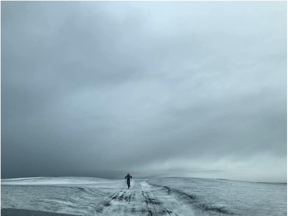
Hjólað heim í nýsnævi á öræfum.

Í Jökulheimum var eldamennska komin vel af stað og bæði eldað fyrir gamaldags kjötætur og nútíma grænkeru. Ó, þvílík dýrðar grænmetis-súpa sem þar var fram borin; og jú, ekki var litla lambið síðra. Seinna kvöld ferðarinnar fór fram í rólegheitum og undir miðnætti voru flestir gengnir til náða. Er ástæða til að hafa áhyggjur af þessu háttalagi?