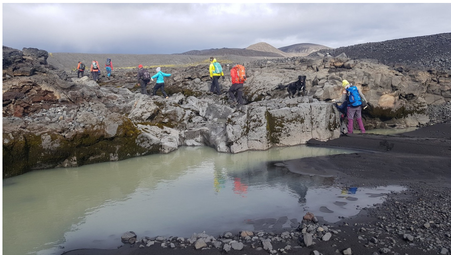
Í nær tómun farvegi Grindakvíslar.

Hópur JÖRFÍ félaga ásamt börnum, mökum og kunningjum, alls 15 manns, lagði upp frá tækniástöðu Veðurstofu Íslands á Vagnhöfða síðdegis föstudaginn 13. september. Haldið var rakleitt í Jökulheima með örlítilli töf vegna fjárreksturs á Skeiðum og smá stoppi í Hrauneyjum til að ná öllum bílum saman. Færi á Jökulheimaleið var með besta móti nema hvað myrkur var ansi svart og tafði það fyrir nokkrum öku mönnum. Í jökulheimum beið okkar einn félagi til viðbótar og síðla kvölds bættist svo við ein mikil fjallkona, ásamt hundstík sinni. Var þá hópurinn fullskipaður, 17 manns og einn hundur. Ekki var neinn ofurgalsi í hópnum og gengið snemma til náða, fyrir miðnætti og hafði „fjallkonan“ á orði að sér þætti nóg um.