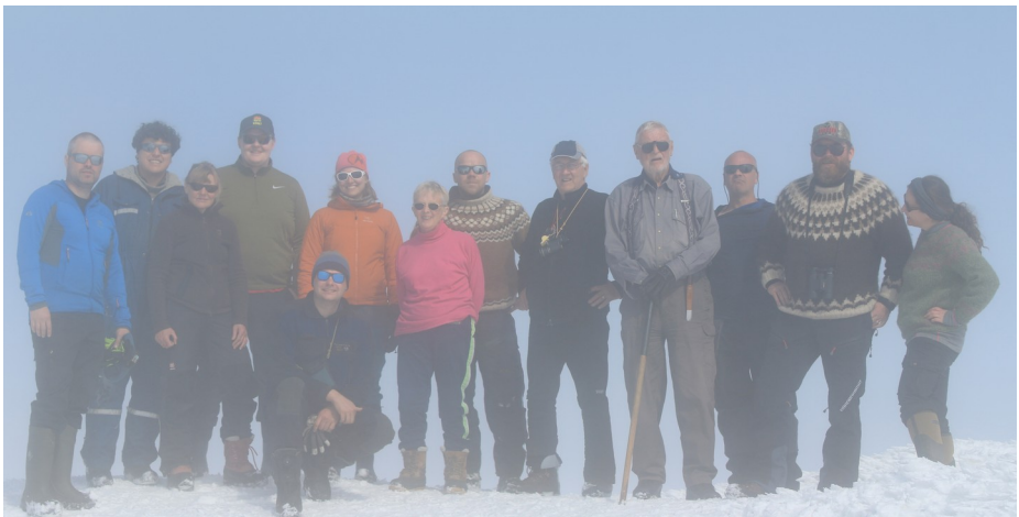
Hluti vorferðar í þöku á JÖRFA í Kverkfjöllum.