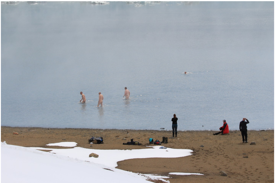
Bað í Gengissigi í vorferð 2019.