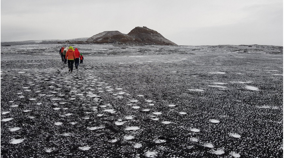
Á göngu að gígnum Mána.

höfum svo oft farið um á leið á og af jökli. Gamlir jökulgarðar ná nánast alla leið upp á Jökulgrindur og reyndar hefur jökullinn runnið yfir þær á einverjum stöðum norðar. Þarna skiptist hópurinn upp. Barnafólk og Sólveig héldu suður að bílunum við Grindakvísl en aðrir héldu norður eftir Jökulgrindum og inn að jökli. Austur úr Jökulgrindum liggur gossprunga með rauðu gjalli áleiðis yfir að Tungnaárjökli. Undir gamla jökulbotninum eru mikið vatnssgrafin hraun og í gegnum höfðann sem leiðin á jökul hefur legið meðfram undanfarin ár hefur Tungnaá grafið þrjú þröng og djúp gljúfur í gegnum bólstra-bergið. Það er áhugaverður gönguhringur að aka norður á aurana, ganga hring í gegnum gígana, hraunin, gamla jökulbotninn og skoða þessa vatnsfarvegi. Heilmikið vatn var í Tungnaá þarna við jökulinn enda allt vatn frá jöklinum, alla leið norður að Kerlingum, þarna komið saman. Nú var skundað til baka í rigningunni sem komin var, um fjögurra kílómetra leið að bílunum, fyrst eftir þurrum áraurunum en seinni hluta leiðarinnar eftir mosagrónum bökkum norðan Grindakvíslar. Þarna er mjög áhugavert og skemmtilegt að ganga um og endalausar jökulminjar að skoða.