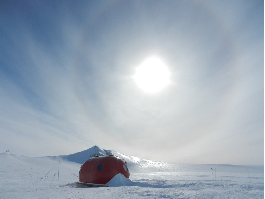
Mynd: Rosabaugur yfir Sky Blu, sumarflugvelli BAS á Suðurskautslandinu.

Útg. JÖRFÍ, Pósthólf 5128, 125 Reykjavík / Ábm. Hálfán Ágústsson