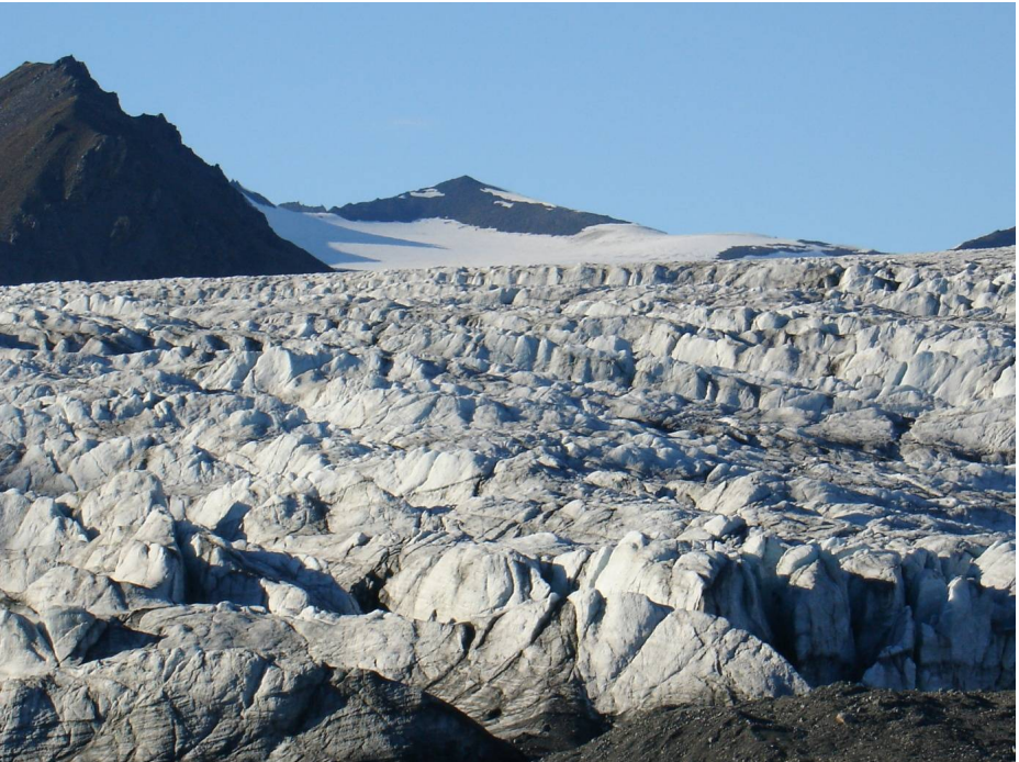
Mynd: Ólafur Ingólfsson