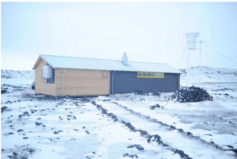
Viðbyggingin í Jökulheimum.