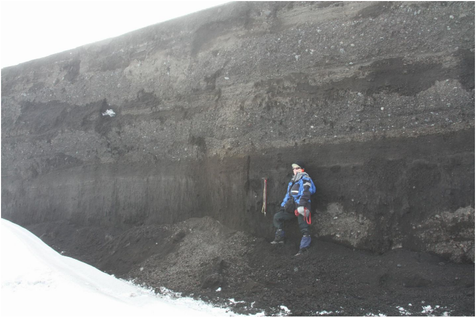
Gjóskubunkar suðvestan gígsins.

Langstærsta verkefnið var að kortleggja þykkt gjóskunnar. Tveir til þrjú hópar voru að staðaldri úti að mæla þykktir og taka sýni og náðust mælingar á um 100 stöðum víðsvegar um vestanverðan Vatnajökul.