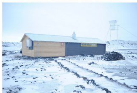
Nokkrar myndir úr smíðavinnu í Jökulheimum.

Útg. JÖRFÍ, Pósthólf 5128, 125 Reykjavík / Ábm. Hálf dán Ágústsson