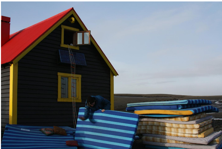
Aska barin úr dýnum í Jökulheimum.

Þessar áætlanir gengu upp, því sunnudaginn 29. maí, degi eftir að eldurinn slokknaði, lagði 19 manna hópur af stað í Jökulheima. Vegna gossins var hætt við sum verkefni en önnur tekin upp í staðinn. Aðalverkefnið var að rannsaka ummerki um gosið.