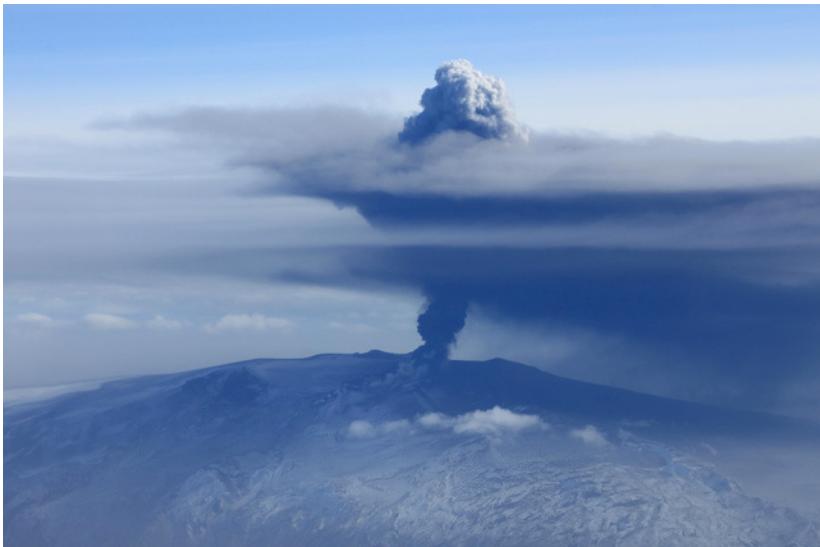
Gríðarlegt öskufall varð fyrstu sólarringa gossins í Eyjafjallajökli.

Ekki hafði fyrr verið lýst yfir goslokum á Fimmvörðuhálsi en gos hófst í toppgíg Eyjafjallajökuls. Það gos var mun stærra og hættulegra.