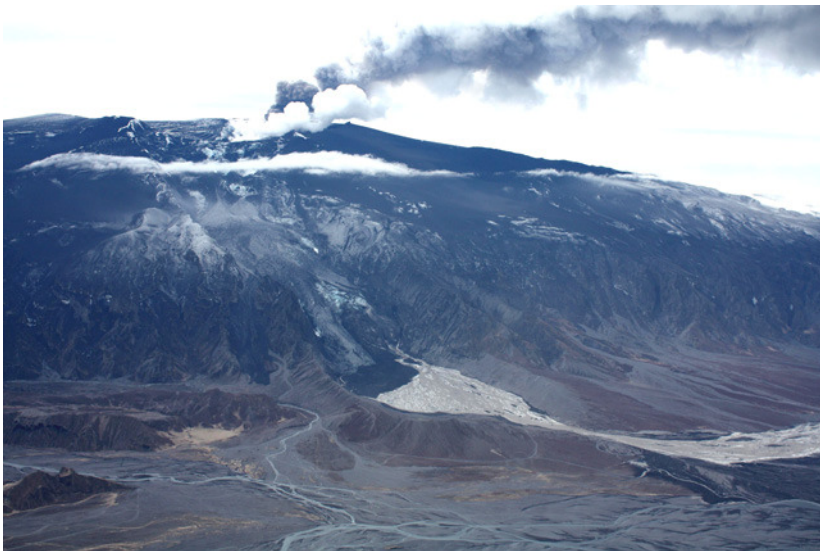
Nágrenni Gígjökuls hefur breyst mikið, lónið horfið og aurarnir innst standa 30-40 metrum hærra vatnsborð þess gerði fyrir gos.

Um viku eftir að gjósa tók í toppgíg jökulsins fór hraun að renna til norðurs í upptökum Gígjökuls. Þar leitar hraunið niður jökulinn og bræðir hann svo af upp af standa miklir gufumekkir. Miklar landbreytingar hafa orðið við Gígjökul og þar sem áður var lón eru nú aurar sem syðst standa allt að 30 til 40 m hærra en vatnsborð lónsins fyrir gos.