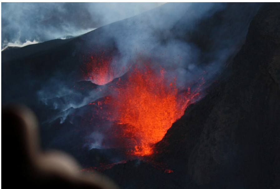
Gossins við Fimmvörðuháls verður einkum minnst fyrir fallega kvikustróka og hraunfossa.

Mælingar á landbreytingum benda til að kvika hafa byrjað að þrýstast upp undir Eyjafjallajökul í desember en það kom nokkuð á óvart að hún skyldi koma upp á yfirborðið við Fimmvörðuháls.